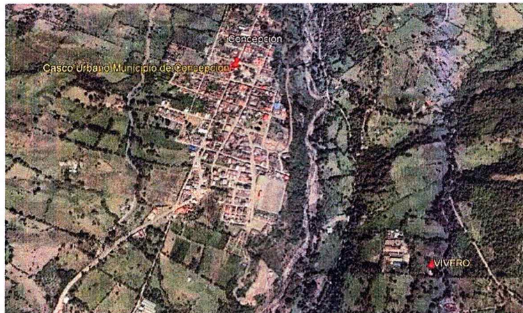
Figura 1. Localización predio para construcción vivero municipal.